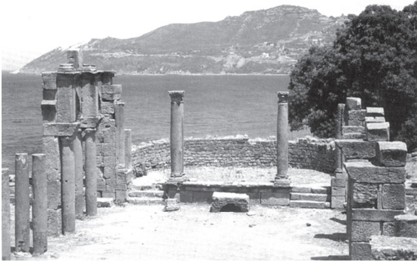
Vue des ruines de la Basilique de Tizirt sur le Cap Taksebt.

inhospitalier. C'est la fidélité à ma mère et à son récit. Par sa tradition religieuse et culturelle, elle avait un rapport très fort et très prégnant à la nature. Elle parlait à la nature. Elle avait une passion pour les arbres fruitiers, notamment l'abricotier, شمشم (mechmech), qu'elle m'a transmise. J'en cultive six dans l'Oise. À notre arrivée d'Algérie en 1967, on s'est installé dans ce département et en 1973 dans une grande maison avec un jardin. Je suis jardinier depuis ce temps. J'ai appris à travailler la terre pour ne pas avoir à effectuer des tâches domestiques. J'ai acquis un héritage pratique qui a pourtant été détruit durant la colonisation. Il m'a été transmis loin du paradis de ma mère.