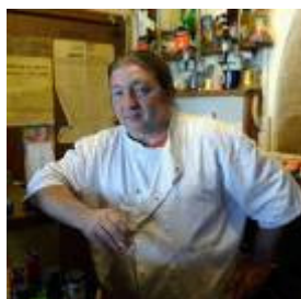
Le Little Pub à Alligny en Morvan Parc naturel régional du Morvan