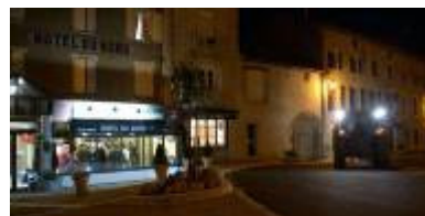
Le restaurant Lou Paouzadou à Buzains Parc naturel régional des Grands Causses