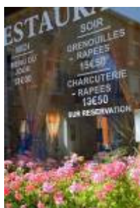
Le Bar de la Fontaine à Cheissoux Parc naturel régional de Millevaches en Limousin